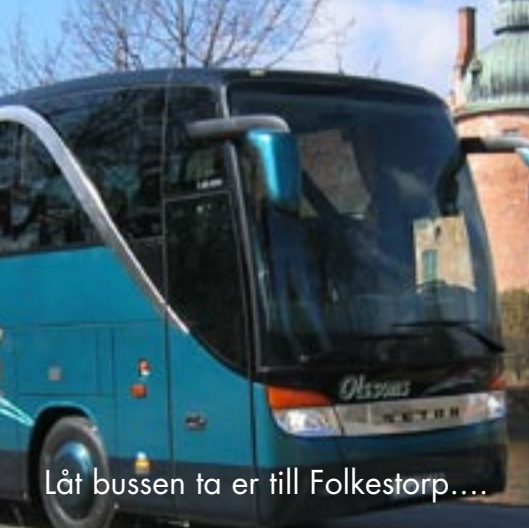
Låt bussen ta er till Folkestorp....