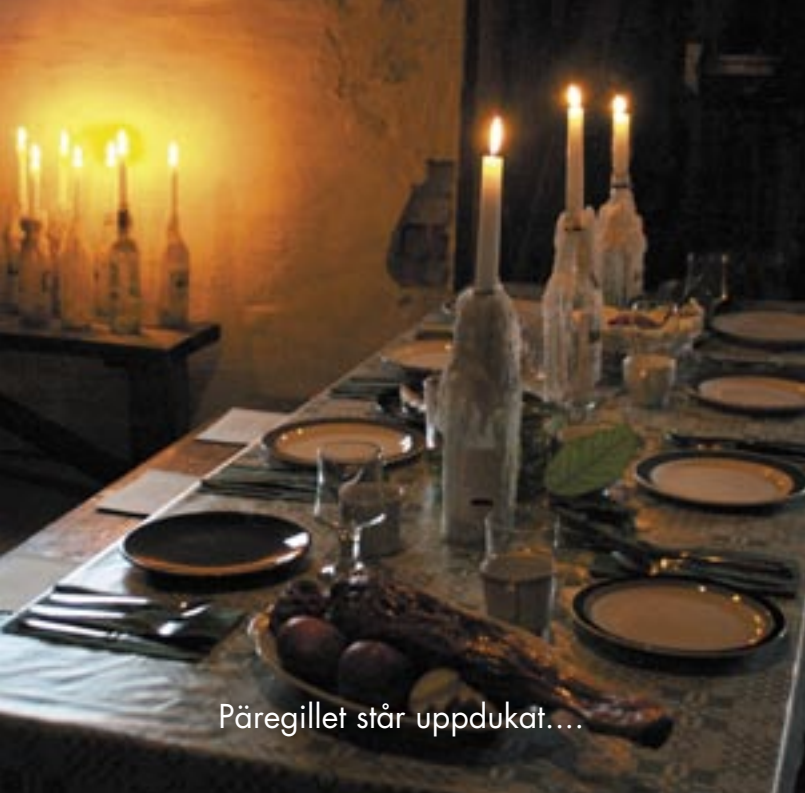
Päregillet står uppdukat...