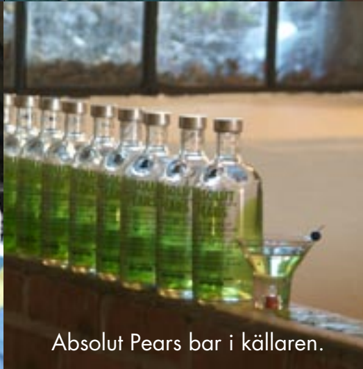
Absolut Pears bar i källaren.