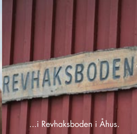
...i Revhaksboden i Åhus.