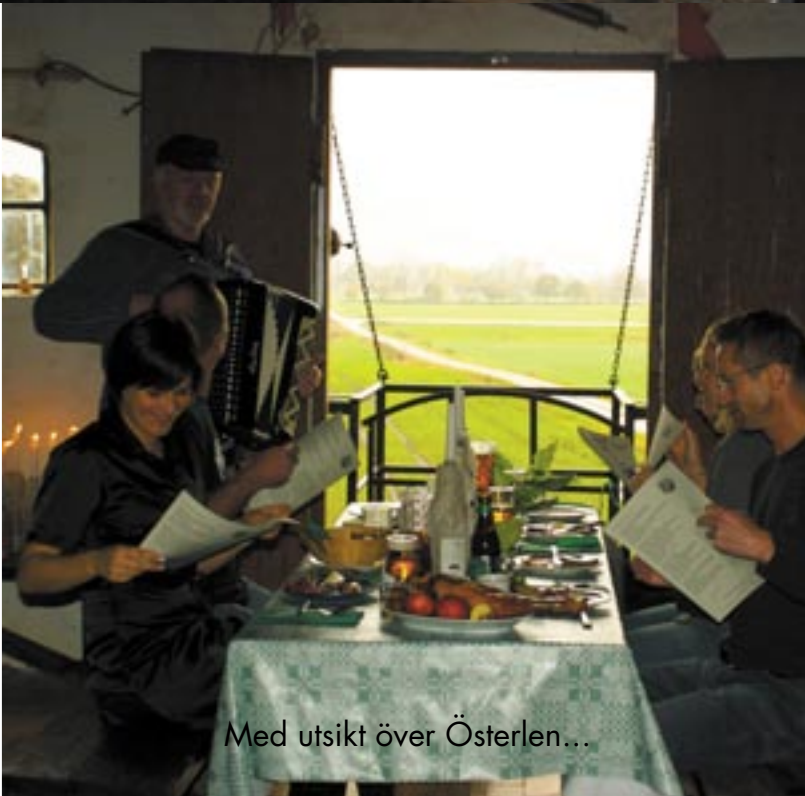
Med utsikt över Österlen...