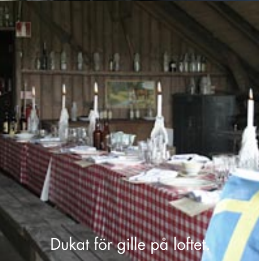
Dukat för gille på loftet.