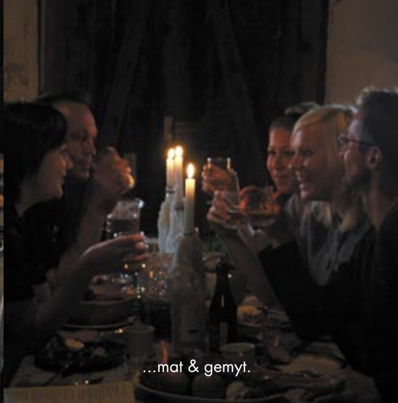
...mat & gemyt.