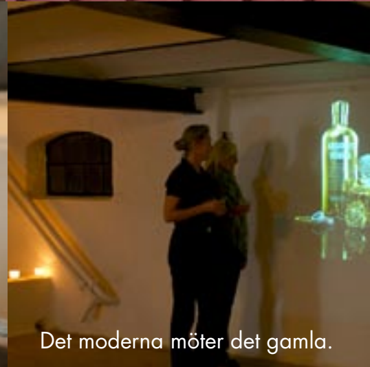
Det moderna möter det gamla.