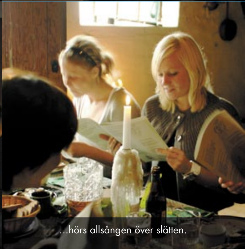
...hörs allsången över slätten.