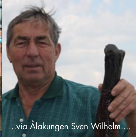
...via Ålakungen Sven Wilhelm....